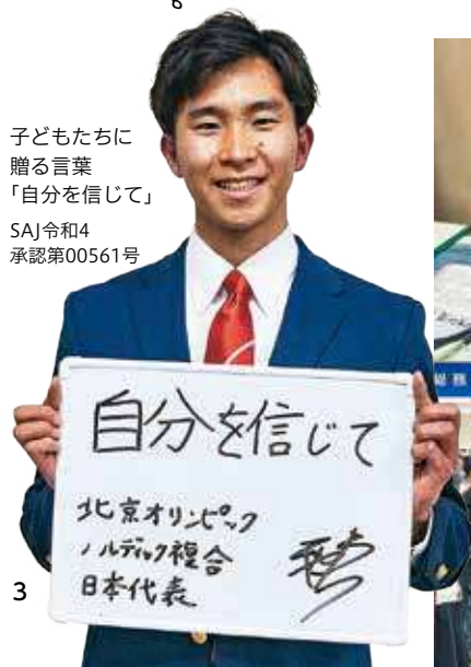
子どもたちに贈る言葉「自分を信じて」 SAJ令和4承認第00561号