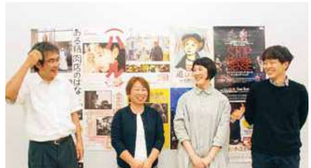
映画好きの有志団体・シワキネマさん

まな情報を発信しています。「つばめの森」で取り上げた方々の活動も、より詳しく紹介しています。