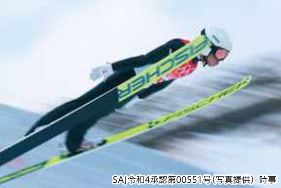
SAJ令和4承認第00551号