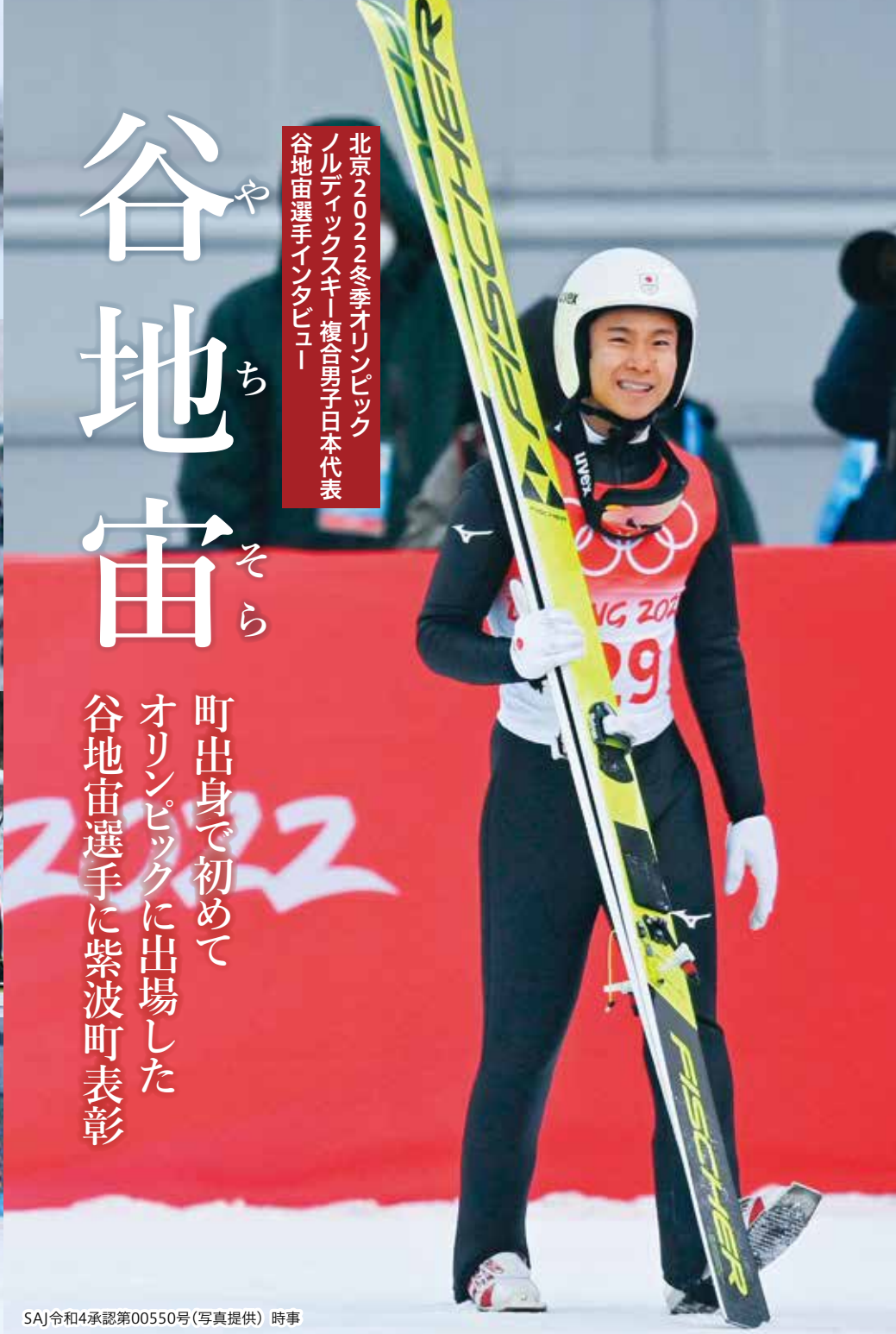
SAJ令和4承認第00550号(写真提供) 時事