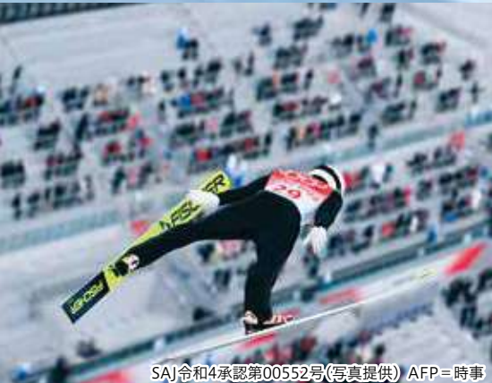
SAJ令和4承認第00552号(写真提供) AFP=時事