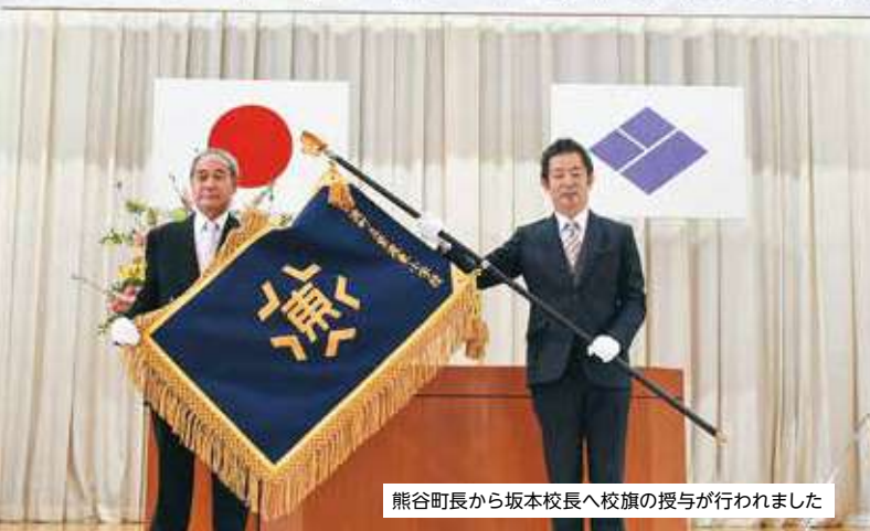
熊谷町長から坂本校長へ校旗の授与が行われました