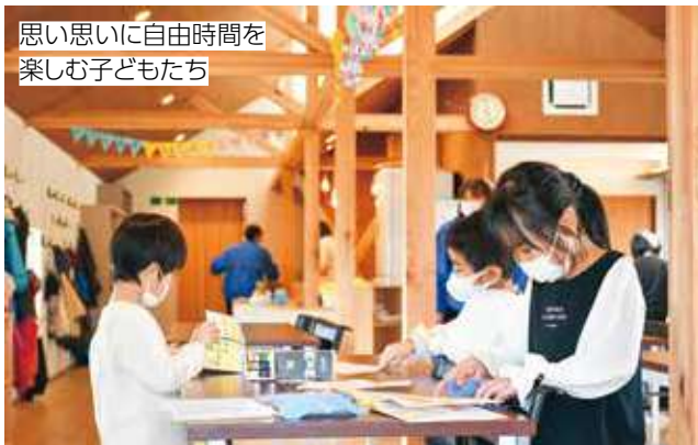
思い思いに自由時間を 楽しむ子どもたち