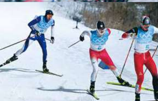
SAJ令和4承認第00553号(写真提供) Lehtikuva/時事通信フォト