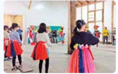
日詰かじ町さんさ踊りに参加する、日詰小学校の皆さん

空気も手伝ってか、当日は多くのお子さん連れのご家族や学生さんのご来場があり、2日間を通じて、ご来場・出店・出演者・スタッフを含め、900人以上の方々に参加いただきました。