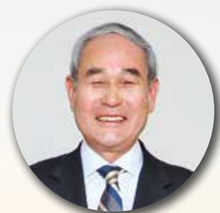
紫波町長 熊谷 泉