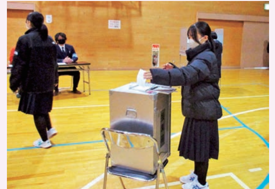
模擬投票を体験する生徒