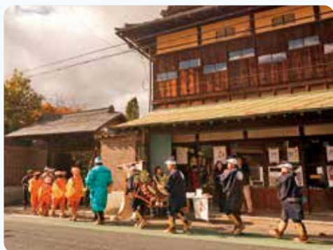
東十日市えんぶり組の皆さんが平井邸の門をくぐる様子

日詰商店街の入り口にあつて、日詰のまちの百年の歴史を見つめてきた日詰平井邸。新たな挑戦も生まれているこの場所で、これからの百年を作っていく起点となるように本イベントのスローガンには「みんなのぶんかさい!」が掲げられました。その名の通り、当日は郷土芸能をはじめとし、マルシェや