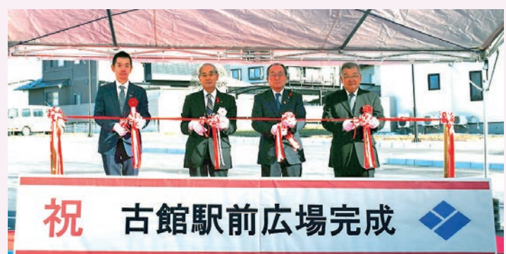
(左から) 村上県議会議員、熊谷町長、 武田町議会議員、古館駅周辺協議会 細川会長