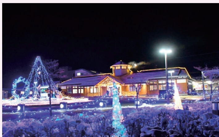
彩られた紫波中央駅前広場

その後、オガール保育園の園児がかわいい歌声を披露。にぎやかに彩られた駅のロータリーから、わんわんパトロール隊が地域の見回りに出発しました。