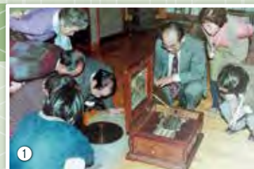
① ディスクオルゴール(レコードコンサートで鑑賞)