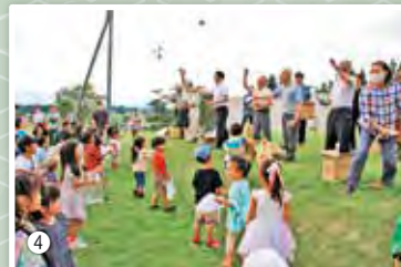
④ 今年も開催するキッズフェスティバル 大好評のお菓子まきの様子