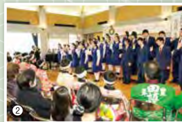
② 恒例となった不来方高校音楽部によるクリスマスコンサート