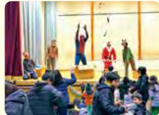
大盛り上がりのお菓子まき

また、長岡未来会議の活動も本格化してきて、空き家活用プロジェクトがいよいよ動き始めました。まずは今月から、活用できそうなお屋敷の掃除を進めます。一緒に作業してくれる人大歓迎です！