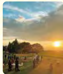
夕陽を見ながら憩う時間

歩やマルシェ、風景を楽しみながら、穏やかで心地よいひとときを過ごし、あらためて長岡の魅力を感じることができました。12月の「長岡クリスマスパーティ」では、地元有志の皆さんのパワーのおかげで、子どもから大人まで一緒に楽しむにぎやかな一日となりました。本年度も開催を目指しているので、楽しみに！