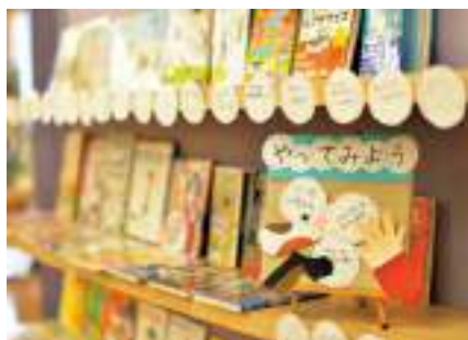
4月「やってみよう」では新しい挑戦を応援する絵本を紹介しました

2025年は、大阪・関西万博、ワールドカップ、東京デフリンピック、世界陸上など、世界の国々について目にする機会が盛りだくさん。「あの選手の出身国ってどこにあるの？」「この国旗のもようはどんな意味？」世界の国々やその文化を知ることができる絵本などを集めて紹介します。