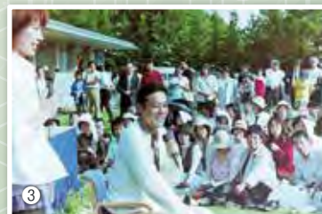
③ 村上弘明さんのトークショーは多くの観客でにぎわいました